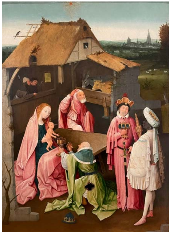
Bosch: Királyok imádása