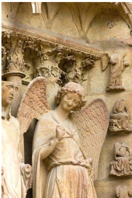
Mosolygó angyal, reims-i székesegyház

Angyal, ki vagy? Bukás? Emelkedés? Önkívület? Tárgyilagosság?