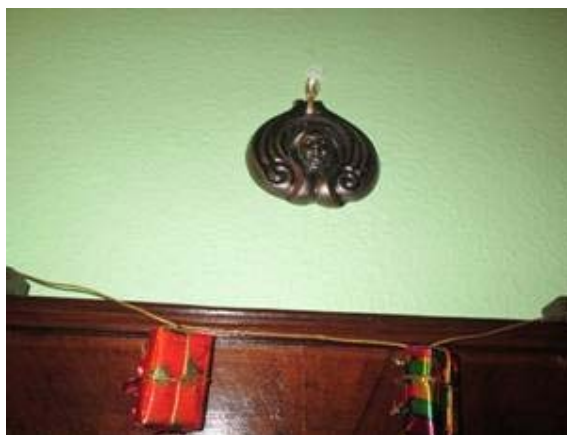
Józsa Judit: Órzóangyal